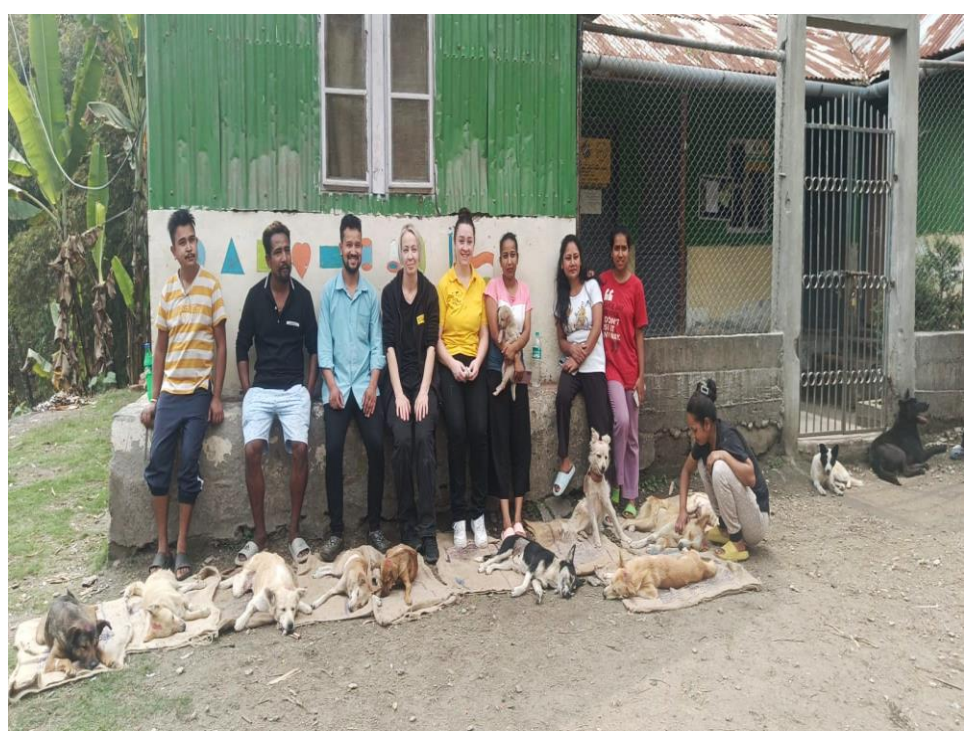
Dogs waiting for their recovery with the DTW members at Badamtam Tea Estate