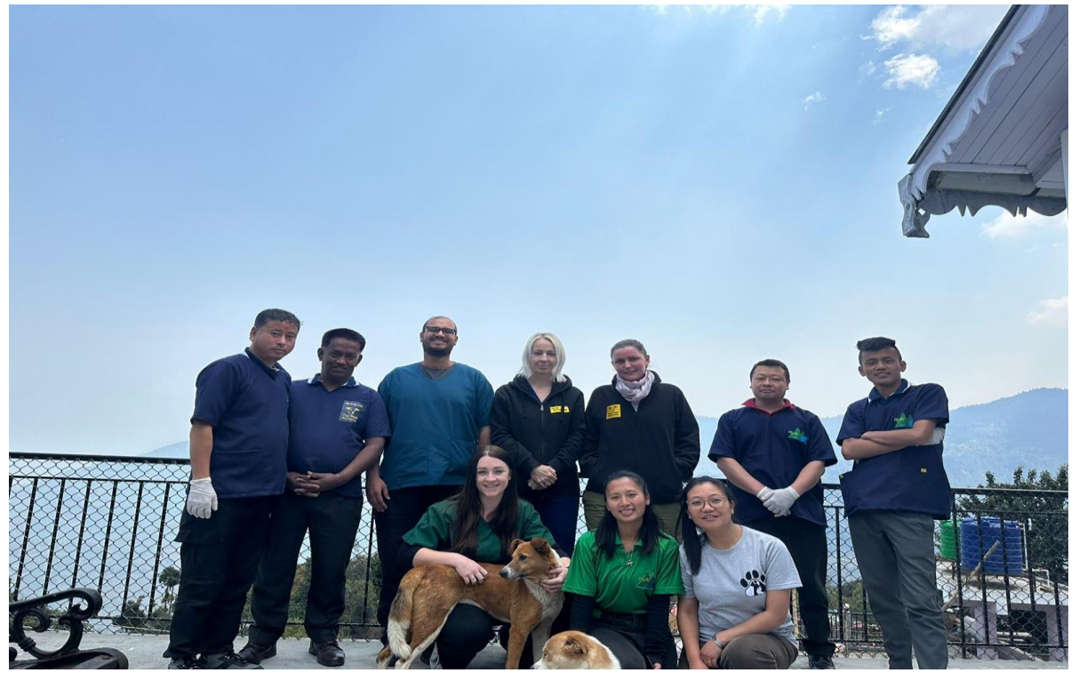
DAS team with DTW members